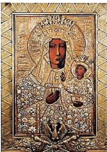
Typus der Gnadenbilder - die Gottesmutter von Jasna Góra - die Schwarze.

Die Führung endet auf dem Marktplatz. Das Herzstück der Stadt mit seinen Tuchhallen, zahlreichen Galerien und schönen Cafés bietet tolle Möglichkeiten, Krakau zu erleben und zu genießen.